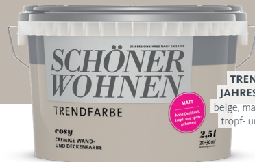
TRENDFARBE DES JAHRES „COSY“ beige, matt, hochdeckend, tropf- und spritzgehemmt

Die Trendfarbe Cosy gibt jedem Raum Charakter und Ruhe, bietet Spielfläche für Licht und Schatten. Ein Beige, in dem sich alle gut aufgehoben fühlen. Dem alles Muntere gehört.