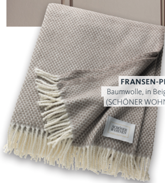
FRANSEN-PLAID „ZEN“ Baumwolle, in Beige, 140 x 200 cm (SCHÖNER WOHNEN-Kollektion)